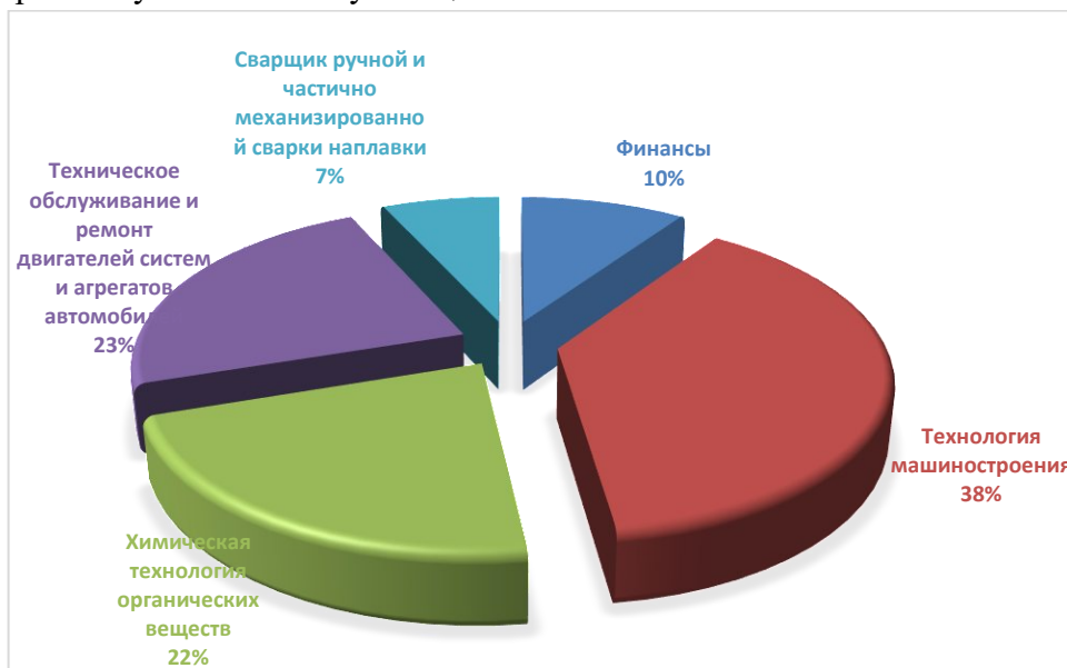
Рисунок - Доля опрошенных обучающихся

В опросе приняли участие 300 обучающихся